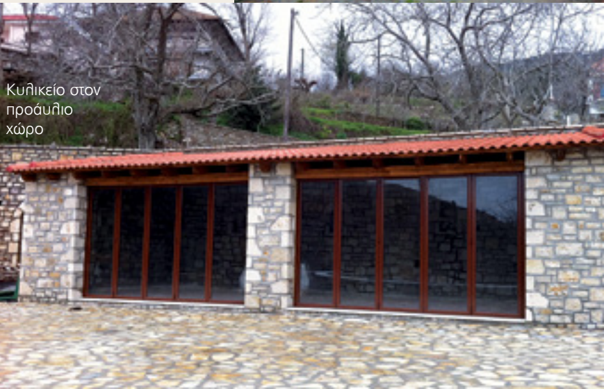
Κυλικείο στον προαύλιο χώρο