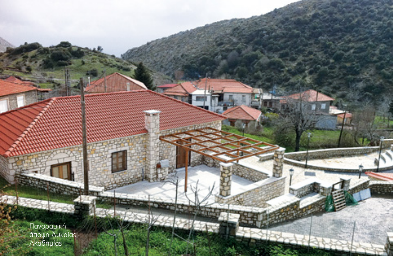
Πανοραμική άποψη Λυκαίας Ακαδημίας

Έργο του συλλόγου, προσφορά στον πολιτισμό και στην Αρκαδία